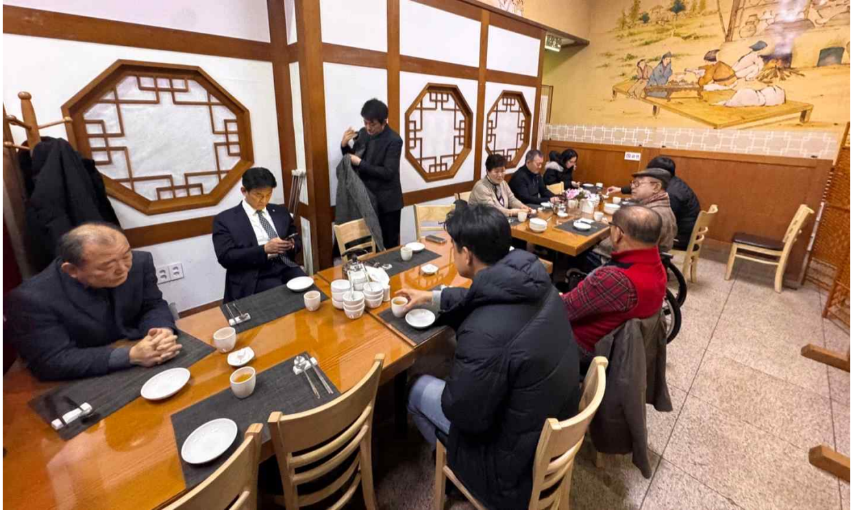
사진2. 이사회 회의