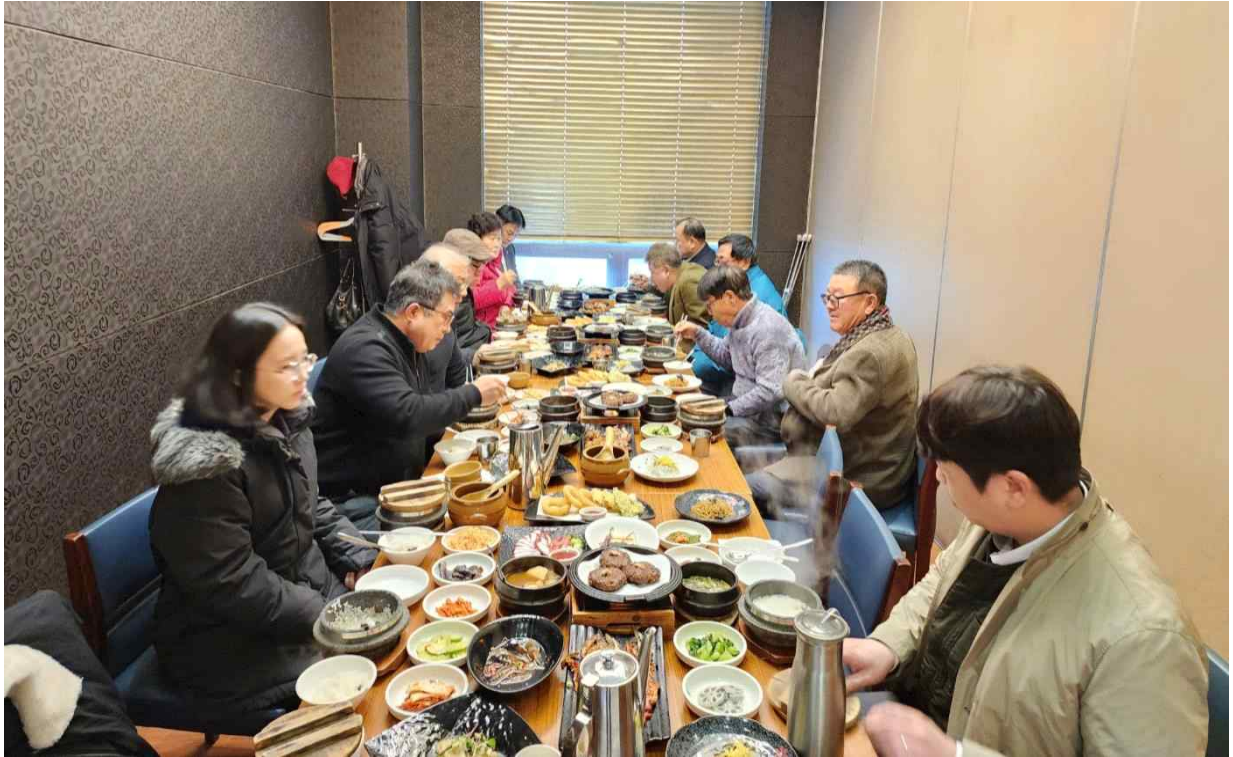
사진2. 이사회 회의