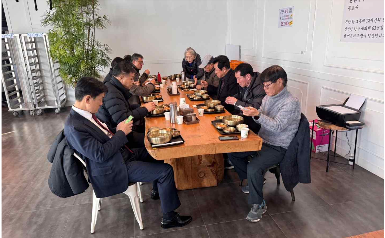
사진2. 이사회 회의